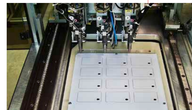
Roboter am Werk: Hier erfolgt die Verlegung kontaktloser Antennen.